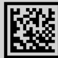
Data Matrix Code

ВНИМАНИЕ! ТОВАР БЕЗ МАРКИРОВКИ — НЕЛЕГАЛЬНЫЙ Проверяйте подлинность товара сканировав код маркировки в приложении «Честный знак» честныйзнак.рф